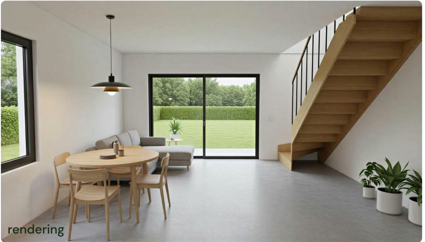
Keuken → living

Renderings van een mogelijke indeling en afwerking van het gelijkvloers.