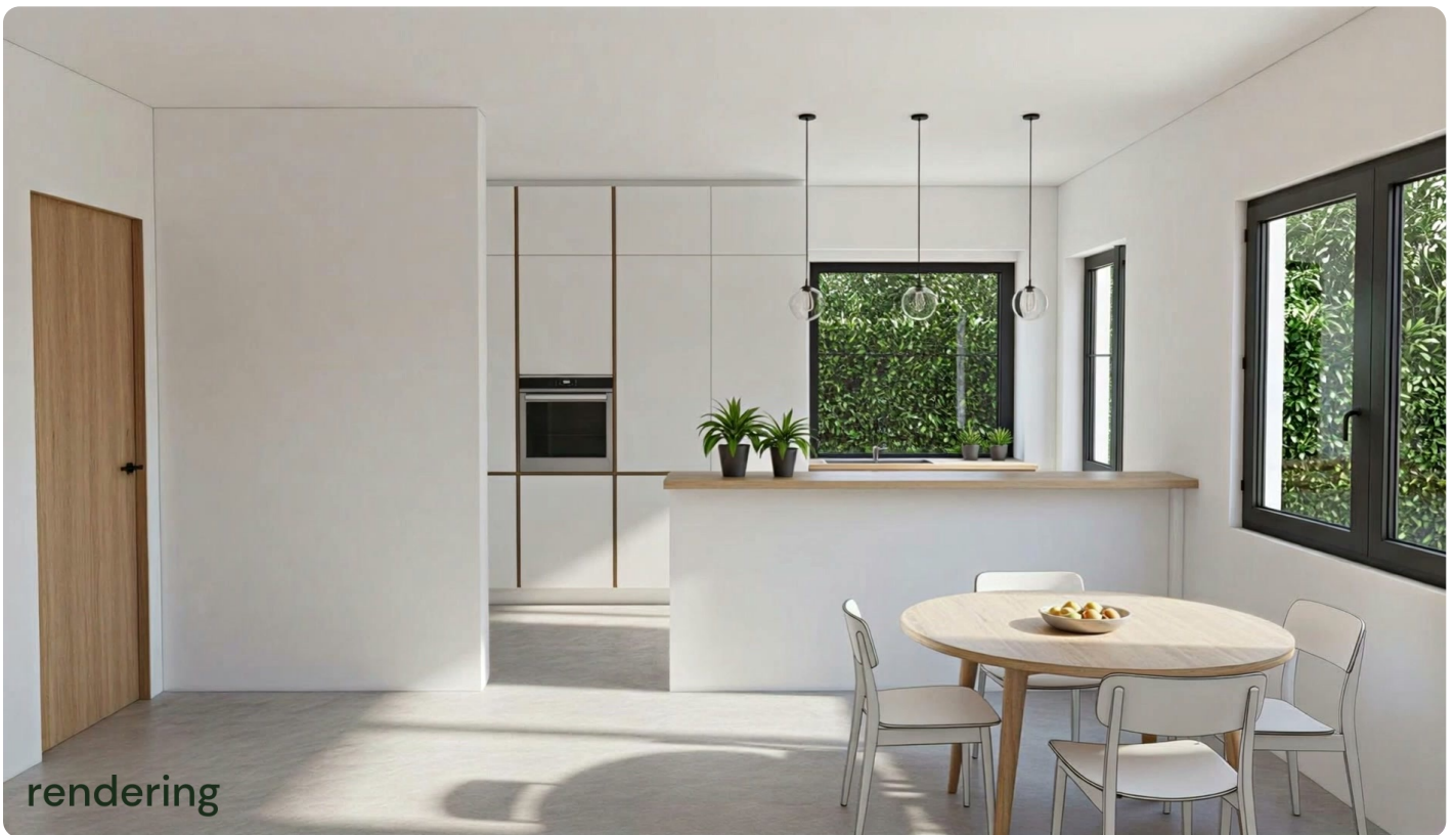
Living → keuken